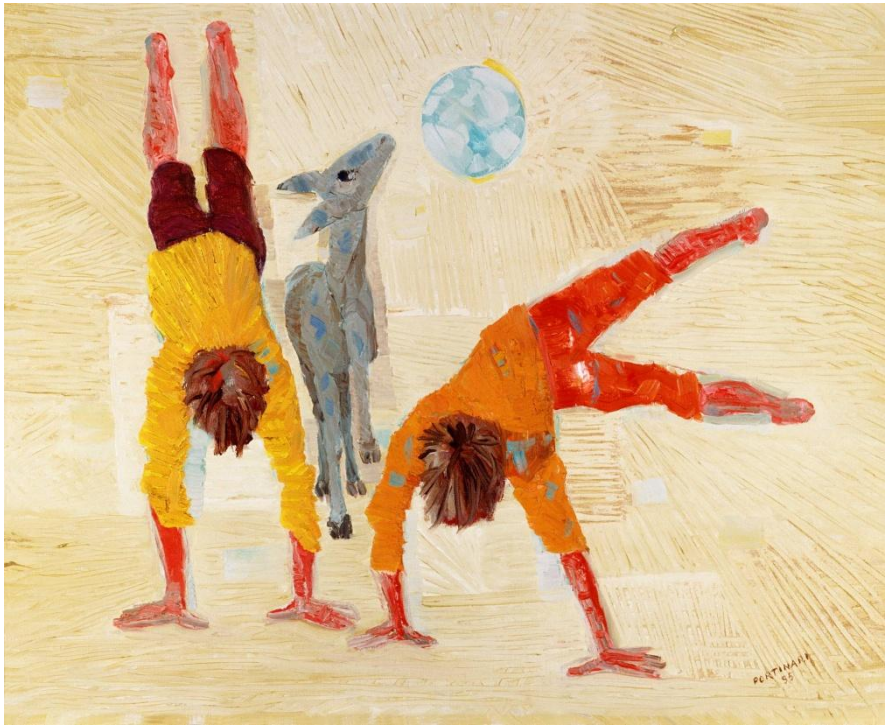
MENINOS BRINCANDO (1955)