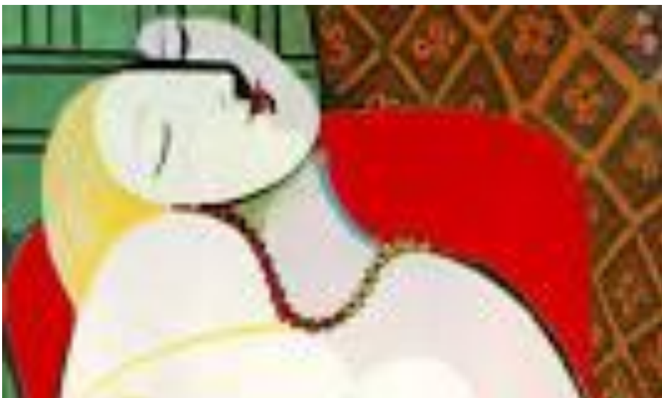
O SONHO (1932)