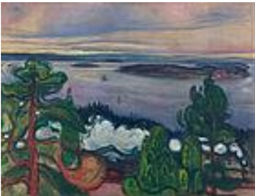
FUMAÇA DE TREM (1900)