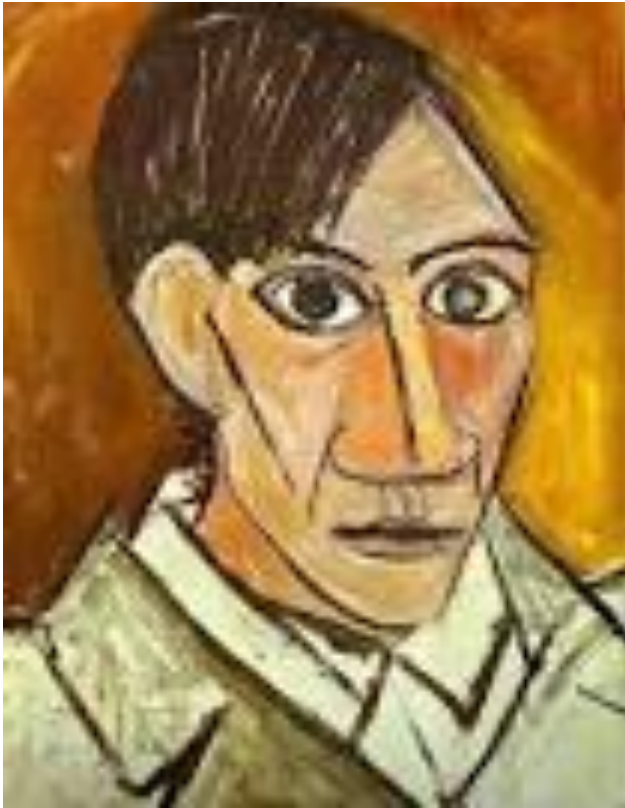
AUTO RETRATO (1907)