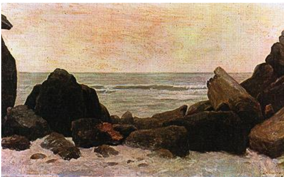
NARINHA, GUARUJÁ (1895)