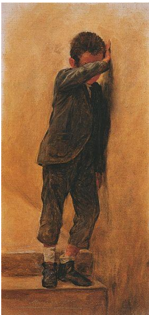
PUXÃO DE ORELHA