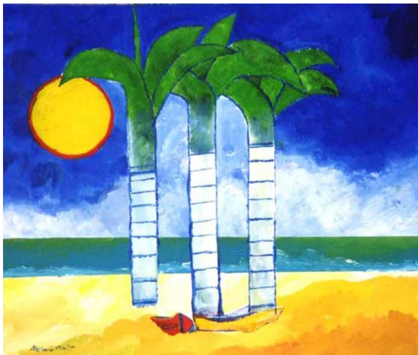
PRAIA DOS TRÊS COQUEIROS