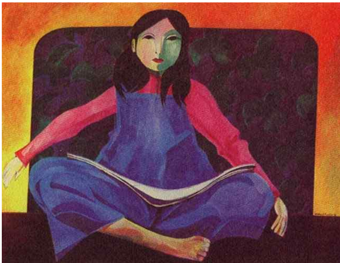
MENINA LENDO (1978)