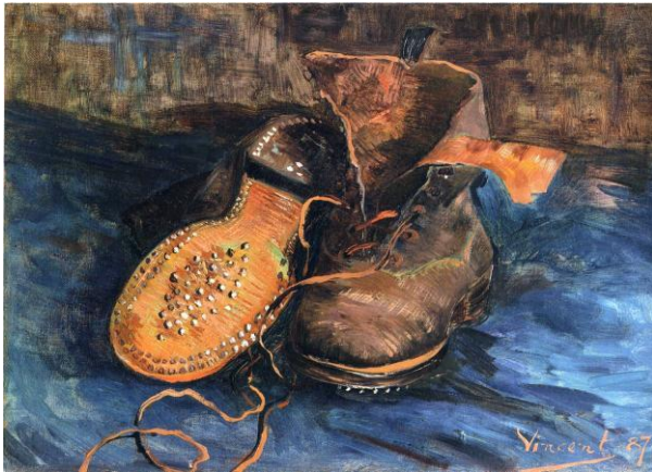
A PAIR OF SHOES