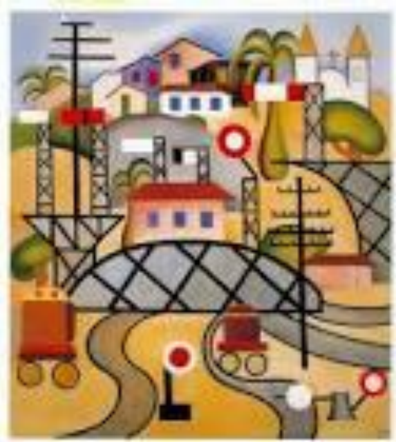
A ESTAÇÃO CENTRAL DO BRASIL