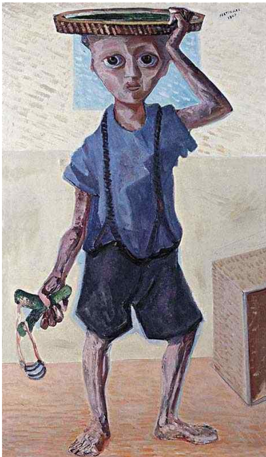
MENINO COM ESTILINGUE (1947)